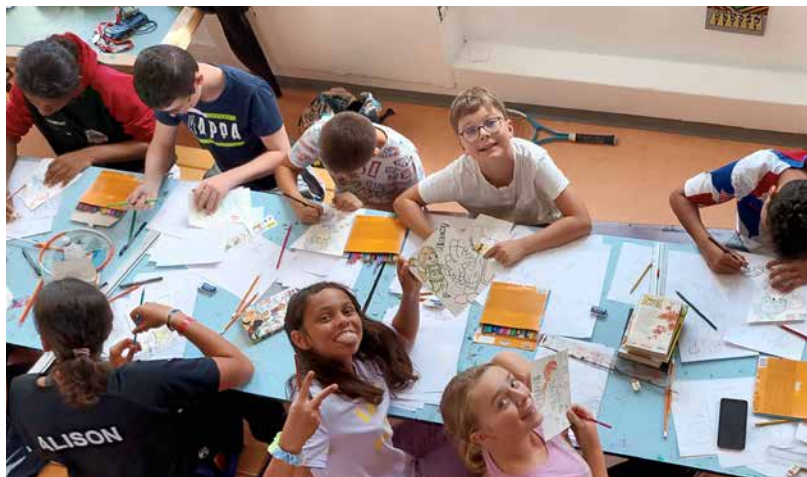
Phase de (ré)création !