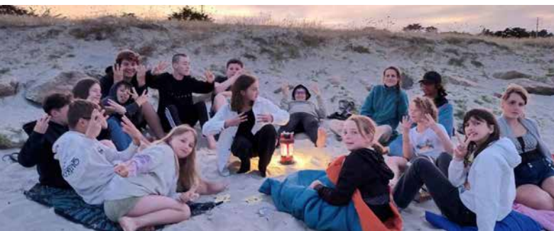
es veillées Loup-Garou, c'est tellement mieux en sac de couchage sur la plage !

Camp 14-17 ans à Moutiers Les Mauxfaits (Vendée) du 31 juillet au 3 août : le camp a été hâtivement organisé suite à l'annulation de l'échange franco-allemand. Les jeunes se sont réunis et se sont mis d'accord pour un séjour « Parcs aquatiques », déjà proposé il y a quelques années (mais auquel ils n'avaient pas participé !), avec en prime une journée plage et karting le 25 juillet.