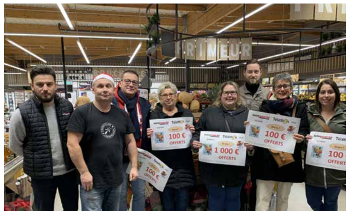
Remise des prix à Intermarché