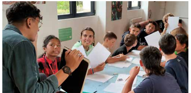
Les apprentis dessinateurs très attentifs aux consignes de Medzi-O !

Stage dessin manga avec Medzi-O proposé la dernière semaine des vacances avant la rentrée. Les jeunes ont créé des personnages mangas pour former une future fresque / maquette de graffiti sur la salle A. Milliat. Des liens se sont créés entre les jeunes et l'artiste ; certains suivent ses stages depuis plusieurs années et ont beaucoup progressé !