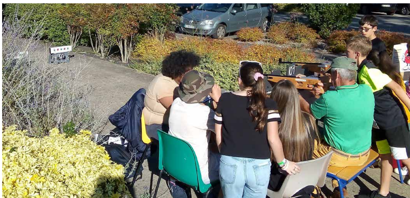
Les enfants du CCE et les jeunes de la MDJ ont initié conjointement les visiteurs de la Fête de La Pomme au « Pom'Biathlon Laser ».

Les enfants du CCE ont été épaulés par les jeunes de la MDJ pour la tenue d'un stand de « Pom' Biathlon Laser » lors de la Fête de la Pomme 2023. L'association Scol'A.I.R. a généreusement financé la location du matériel.