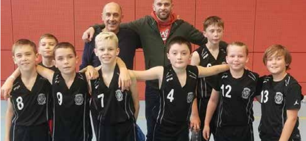
U11 M et leurs coachs