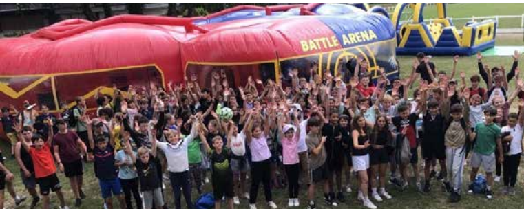
Esprit d'équipe et convivialité lors de l'Interville de Saint Nolff.