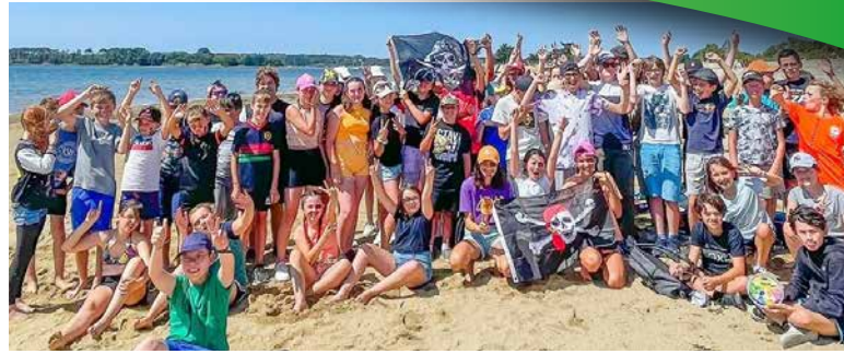
Savoir s'orienter avec une carte et résoudre des énigmes, être observateur, rapide et soudé avec ses coéquipiers : telles sont les qualités des bons chasseurs de trésors !

La MDJ de Sulniac a, quant à elle, organisé une Chasse au Trésor inter-MDJ à l'Île d'Arz . 64 jeunes de 10-14 ans de Sulniac, Theix, Monterblanc, Sarzeau et Ste Anne d'Auray ont relevé le défi. Ce grand jeu de piraterie par équipe a mis en avant le patrimoine et l'histoire de l'île, l'exposition temporaire de l'artiste Daniel Buren et s'est terminé par une baignade sur la grande plage. L'édition 2023 est remportée par l'équipe de Theix !