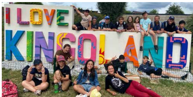
La MDJ adore Kingoland !