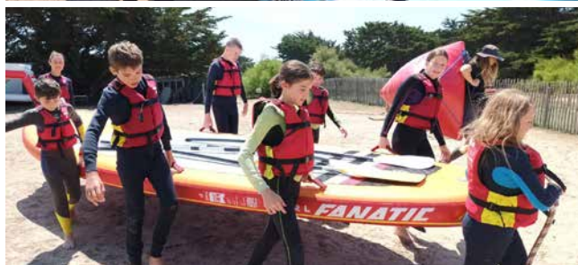
Les équipages vont faire la course en Giant SUP !