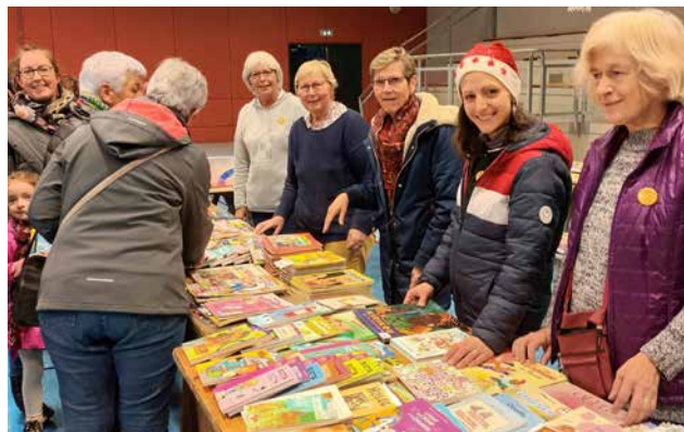
Des bénévoles de Plaisir de Lire ont organisé la bouquinerie qui a rapporté 225 € pour le Sulnéthon.

L'association Plaisir de Lire a organisé une bouquinerie pour soutenir le Sulnéthon. Nous remercions les généreux donateurs de livres qui nous ont permis de mettre en place cette action. Merci aussi aux acheteurs d'avoir donné une seconde vie aux livres tout en soutenant le Sulnéthon.