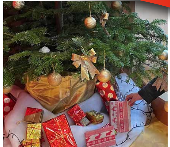
A Noël, Félix a fait parvenir des cadeaux-livres pour alimenter le fonds de lectures allemandes.

Le loto animé par Gégé, a également eu lieu le 4 février à 14h.