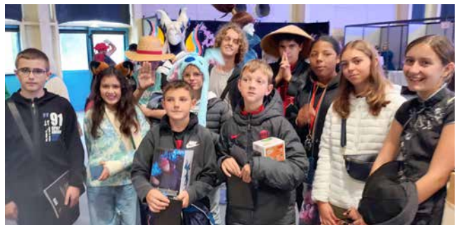
Les fans de mangas de la MDJ au Sekai Festival au Chorus.

Sortie salon du Manga (Sekai Festival) à Vannes : dans la continuité du travail effectué avec Medzi-O et de la dynamique du groupe de dessinateurs.