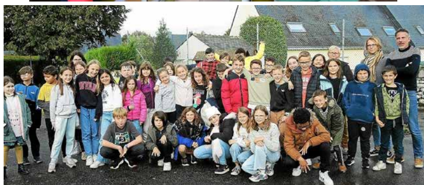
Les élections du CCE se sont déroulées les 19 et 20 octobre, à l'école Saint Jean-Baptiste et à la MDJ.

Une journée d'intégration s'est déroulée le vendredi 27 octobre. Les nouveaux conseillers ont pu faire connaissance au travers d'animations ludiques. De nombreux jeux étaient proposés pour se préparer de façon détendue à prendre la parole en groupe, argumenter ses idées et organiser les groupes de travail.