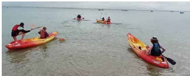
Sortie découverte de la faune et de flore locale en kayak de mer !

15 jeunes de la MDJ ont pu s'initier au paddle, partir à la découverte de l'écosystème en kayak et défier les vagues en Giant SUP. Sur les chemins et en forêt, ils ont pu se rafraîchir en pratiquant l'accrobranche et se balader en direction des Menhirs de Carnac en trottinette électrique et Segway. Le groupe a tellement bien géré son budget qu'ils ont pu s'offrir un extra au snack du camping !