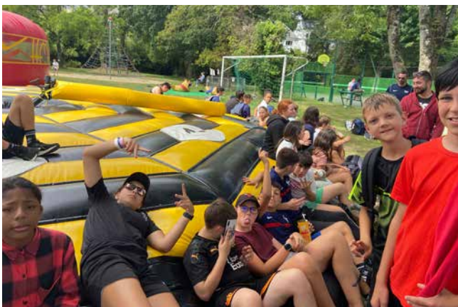
La team de Sulniac a tout donné !

La MDJ de Sulniac a, quant à elle, organisé une Chasse au Trésor inter-MDJ à l'Île d'Arz . 64 jeunes de 10-14 ans de Sulniac, Theix, Monterblanc, Sarzeau et Ste Anne d'Auray ont relevé le défi. Ce grand jeu de piraterie par équipe a mis en avant le patrimoine et l'histoire de l'île, l'exposition temporaire de l'artiste Daniel Buren et s'est terminé par une baignade sur la grande plage. L'édition 2023 est remportée par l'équipe de Theix !