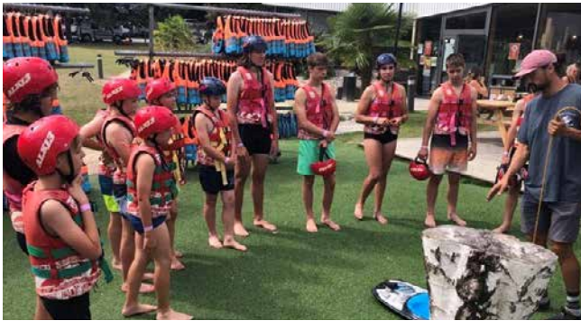
Petit briefing avant de se lancer sur la base de téléski nautique à Nozay.

Sorties inter-MDJ : à l'Aquapark rafraîchissant de Nozay, Boom Party avec DJ à l'Espace Jean LE GAC de St Avé, Interville à St Nolff et Chase Tag à Sarzeau... Ces activités sont stimulantes pour les jeunes avec une ouverture sur d'autres sites, d'autres groupes de jeunes, des nouveautés agréables pour les défis ! Pour les MDJ, c'est aussi un moyen malin de mutualiser transports et moyens matériels.