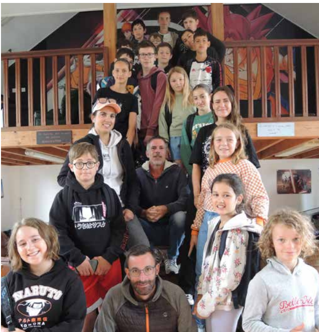
Le groupe prêt au départ matinal pour Kingoland !

Sortie à Kingoland : Enorme attente pour cette sortie, comme l'an dernier ! Une seconde sortie a donc été proposée pour 16 autres jeunes le 27 juillet (en plus du programme prévu). Le parc a évolué et correspond maintenant très bien à la tranche d'âge 10-14 ans ; assez grand pour avoir le choix des manèges à sensation, assez petit pour circuler en relative autonomie.