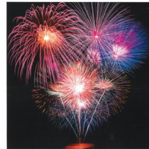
Le Gorvello Sulniac - Theix Le 13 juillet 2015